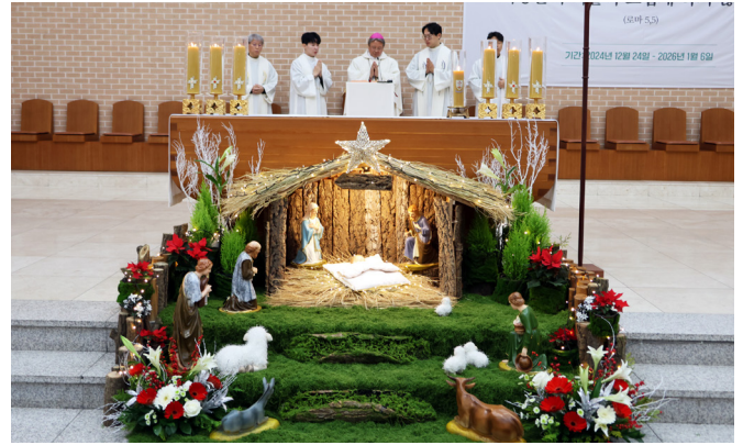
낮미사 - 주교좌 목성동 성당