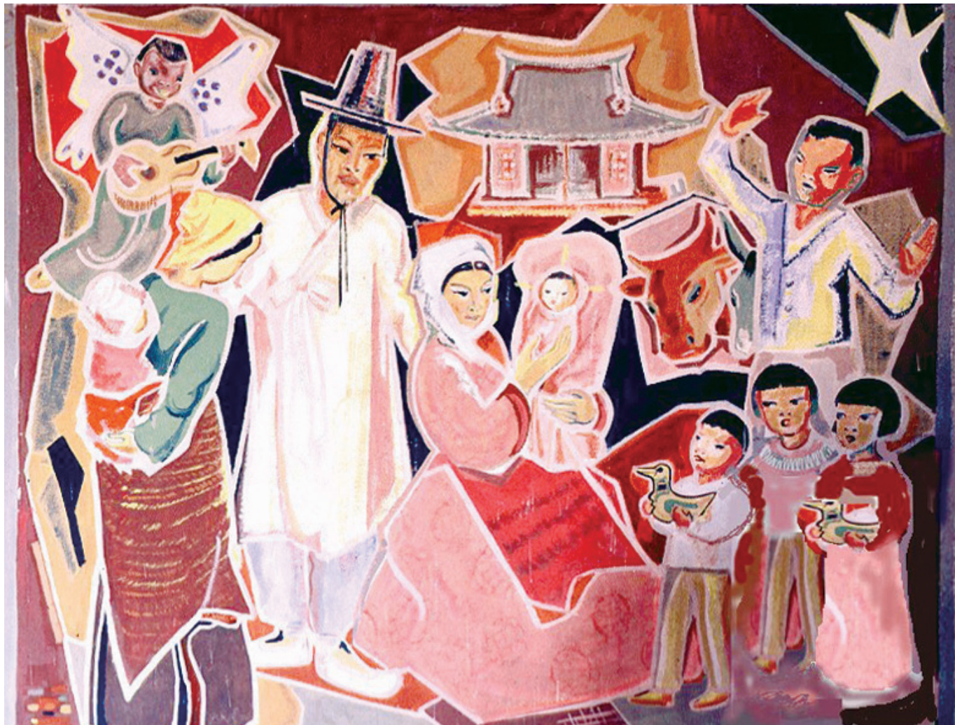
한국판 아기예수의 탄생(앙드레 부통 신부 작, 옥산성당)

우리는 동방에서 그분의 별을 보고 그분께 경배하러 왔습니다.(마태 2,2)