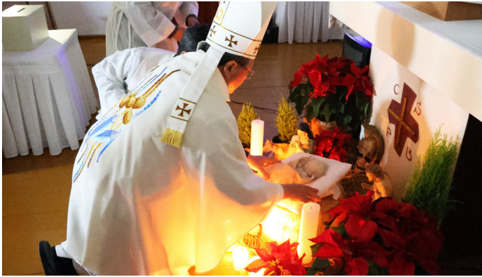
밤미사 - 상촌공소

성탄은 우리에게 있어서 모든 관계의 새로운 시작이 됩니다. 새로운 출발이 됩니다. 우리에게 새롭게 오신 예수님 덕분에 우리는 이제 더 이상 과거에 얽매이지 않고 우리 안에서 새롭게 시작하시는 예수님만 바라보며 앞으로 나아갈 것입니다. (교구장 주교님 성탄메세지 중.)