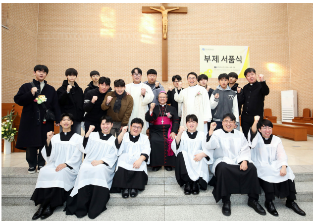
〈새부제와 신학생, 예비신학생〉

1월 11일(주일) 주교좌 목성동 성당에서 교구장 주교님 주례로 부제 서품식이 있었습니다. 주님의 복음 선포자로서 “읽는 것을 믿고 믿는 것을 가르치며 가르치는 것을 실천”할 수 있도록 기도를 부탁드립니다. 아울러 사제·수도 성소를 위한 지속적인 관심과 기도를 부탁드립니다.