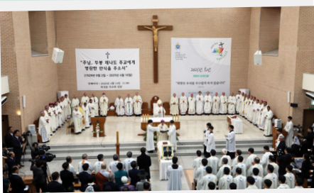
두봉 주교님 선종