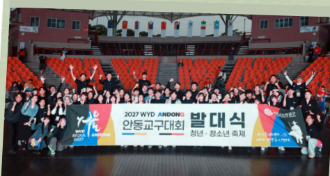
WYD 교구대회 발대식