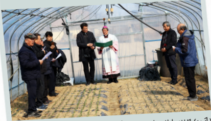
가톨릭 농민회 분회방문(10권)