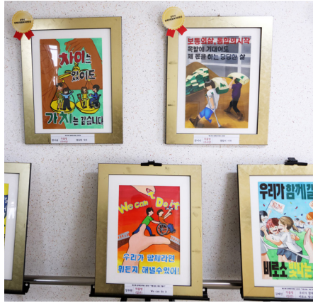
12월 2일(화) 상주시장애인종합복지관