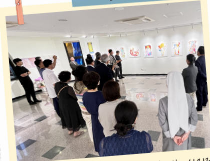
앙드레 부통 신부 벽화 사진전