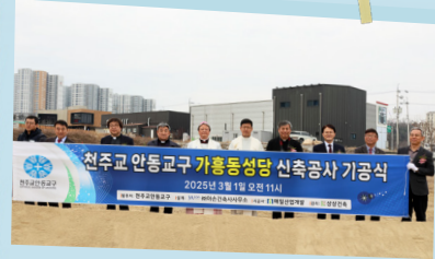
영주 가흥동 성당 신축공사 기공식