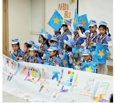
12월 12일(금) 안동시종합사회복지관