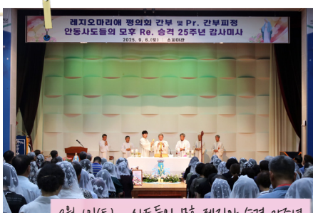
9월 6일(토) 사도들의 모후 레지마 승격 25주년

레지오마리애 평의회 간부 및 Pr. 간부파견 안동사도들의 모후 Re. 승격 25주년 감사미사