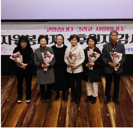
11월 28일(금) 영주종합사회복지관

교구 사회복지 법인 산하 복지관들이 한 해동안 가난하고 소외된 이웃들을 위한 섬김과 나눔에 함께 해주신 봉사자들과 후원자들을 모시고 감사의 날을 지냈습니다.